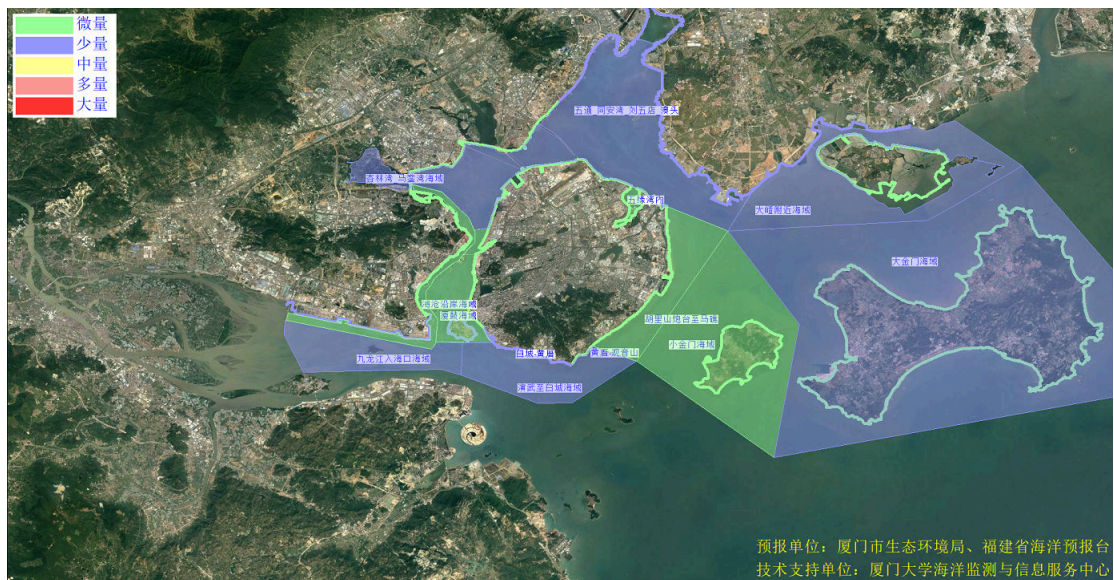
图 2 可能影响厦门湾沙滩的垃圾分区图