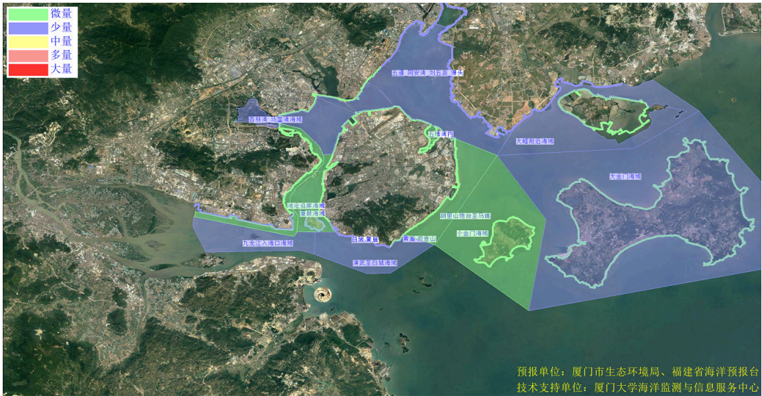
图 2 可能影响厦门湾沙滩的垃圾分区图