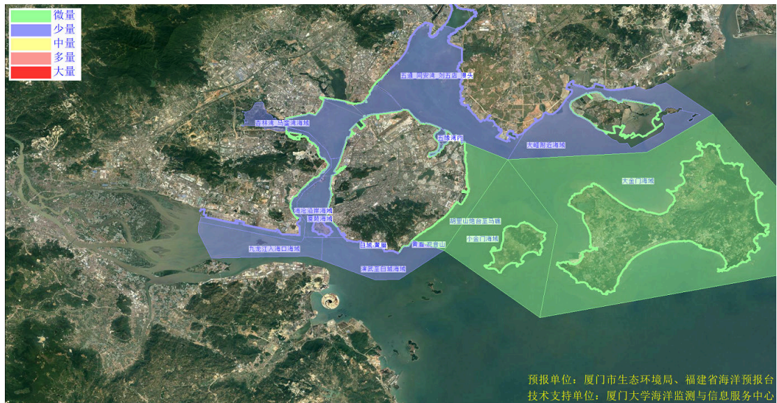
图 2 可能影响厦门湾沙滩的垃圾分区图