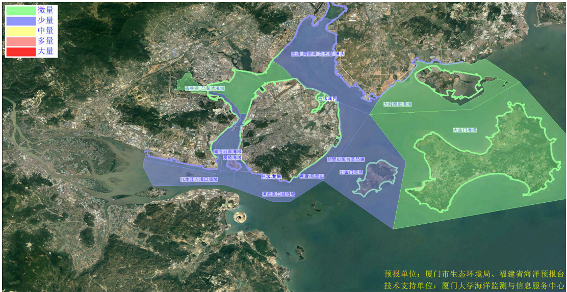
图 2 可能影响厦门湾沙滩的垃圾分区图