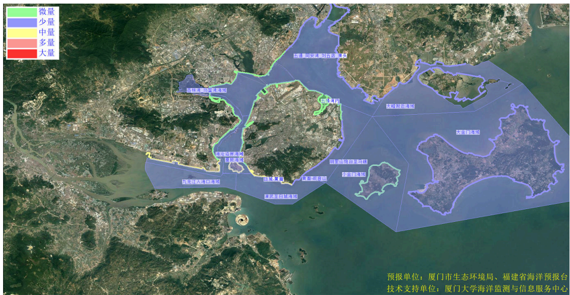
图 2 可能影响厦门湾沙滩的垃圾分区图