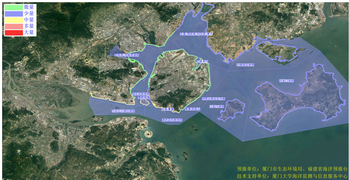
图 2 可能影响厦门湾沙滩的垃圾分区图