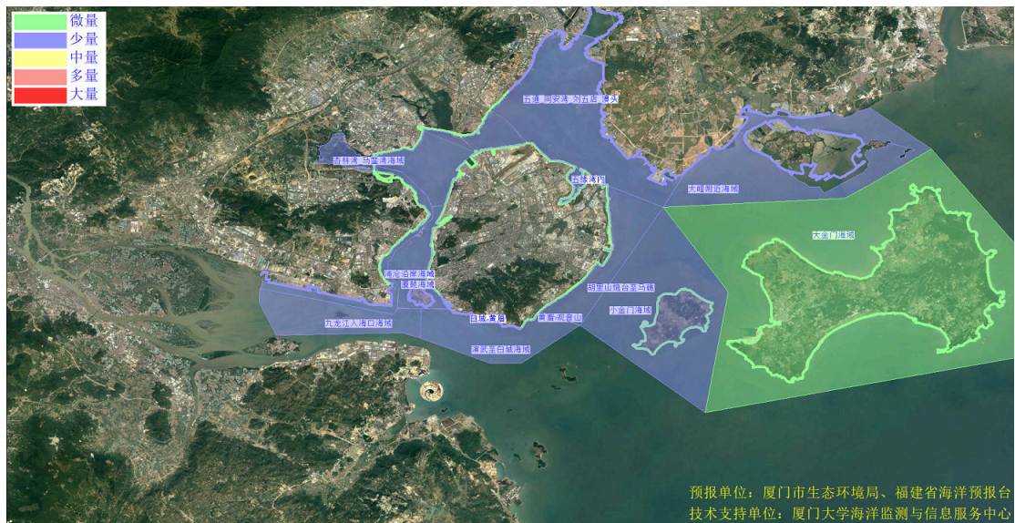
图 2 可能影响厦门湾沙滩的垃圾分区图