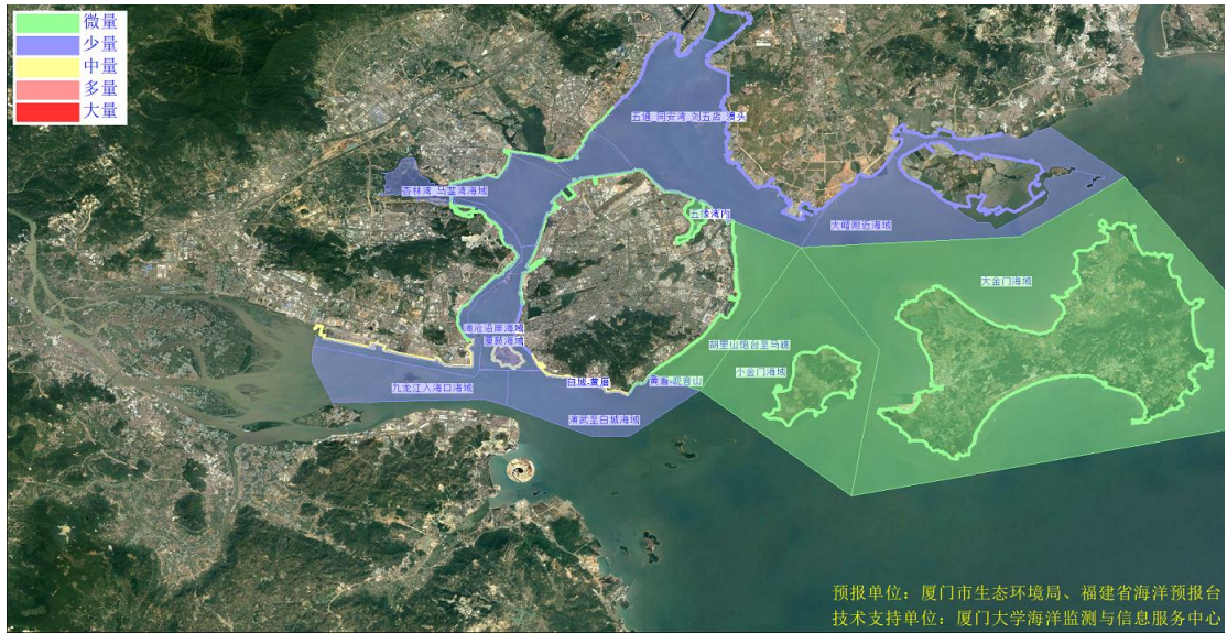
图 2 可能影响厦门湾沙滩的垃圾分区图