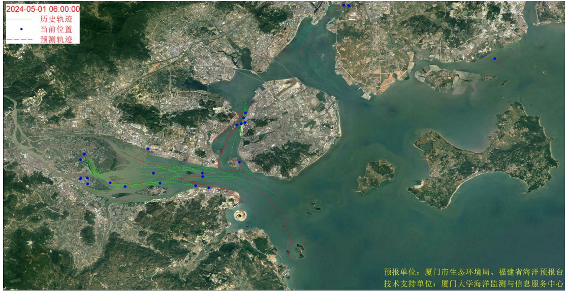
图 1 厦门湾全海域海漂垃圾漂移轨迹预报图