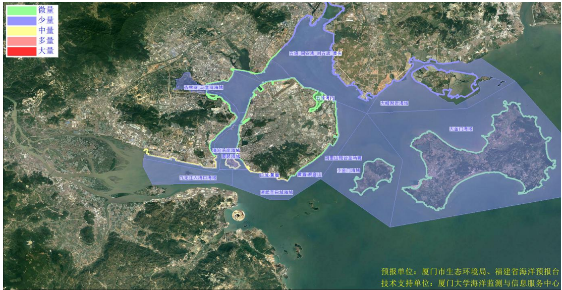
图 2 可能影响厦门湾沙滩的垃圾分区图