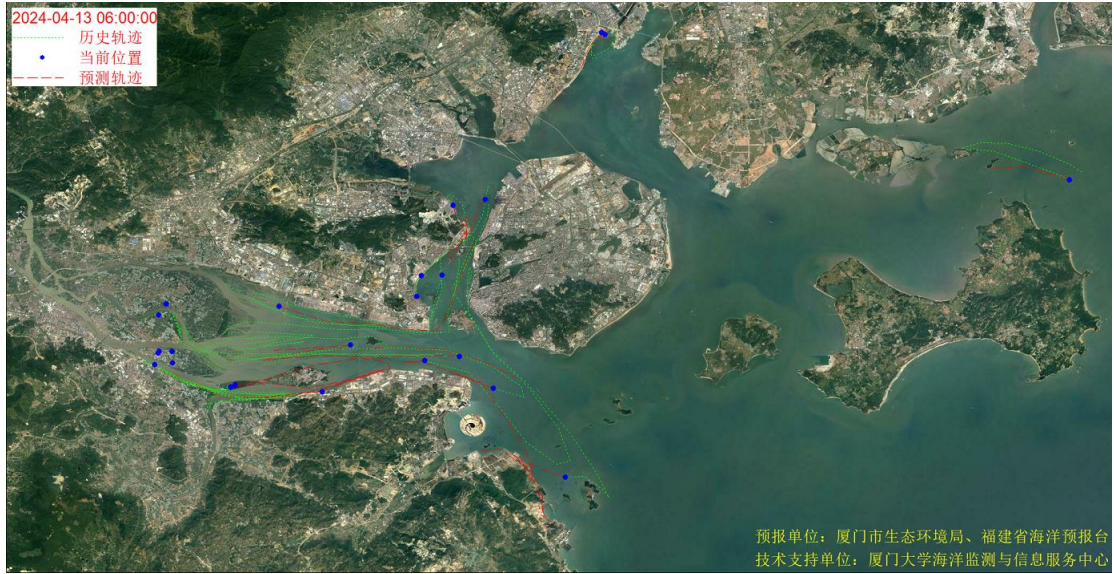
图 1 厦门湾全海域海漂垃圾漂移轨迹预报图