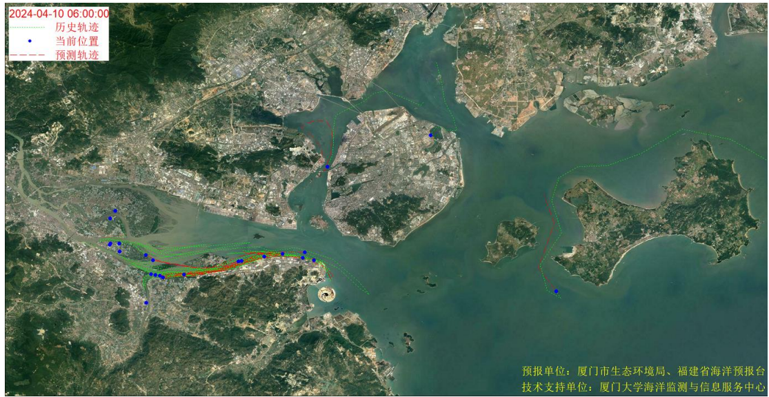
图 1 厦门湾全海域海漂垃圾漂移轨迹预报图