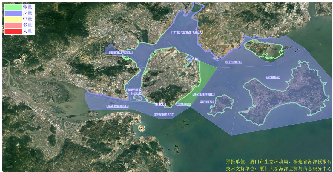
图 2 可能影响厦门湾沙滩的垃圾分区图