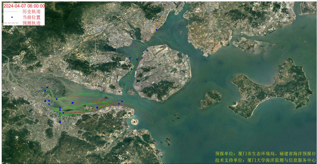
图 1 厦门湾全海域海漂垃圾漂移轨迹预报图