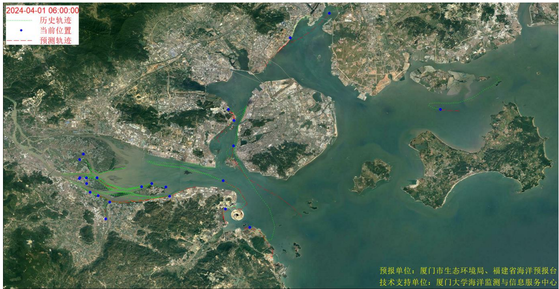
图 1 厦门湾全海域海漂垃圾漂移轨迹预报图