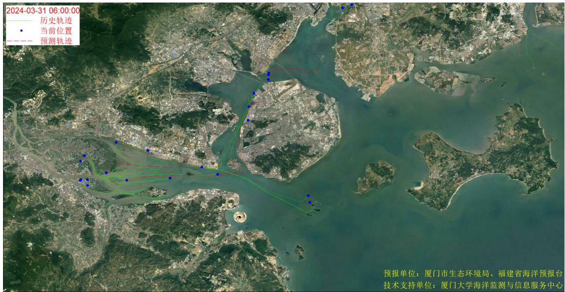
图 1 厦门湾全海域海漂垃圾漂移轨迹预报图