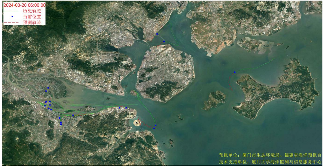
图 1 厦门湾全海域海漂垃圾漂移轨迹预报图