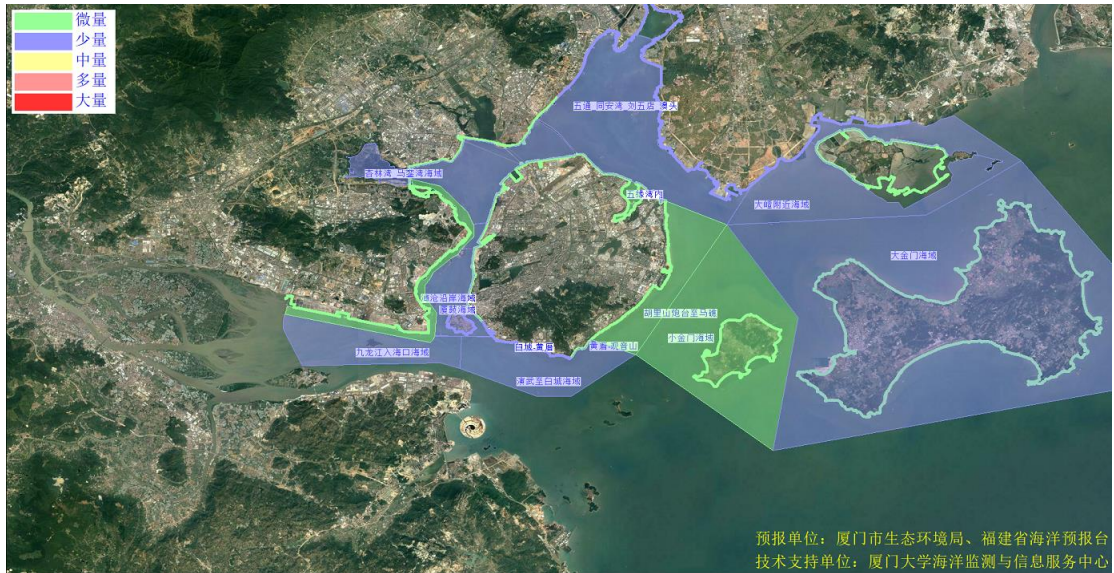
图 2 可能影响厦门湾沙滩的垃圾分区图