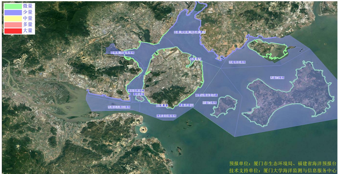
图 2 可能影响厦门湾沙滩的垃圾分区图