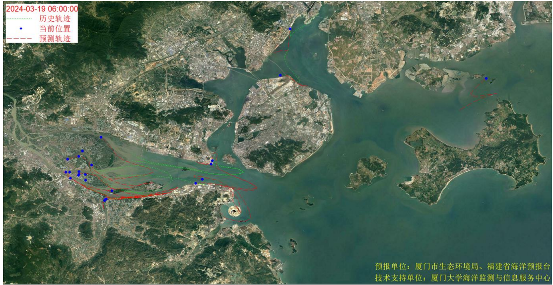
图 1 厦门湾全海域海漂垃圾漂移轨迹预报图