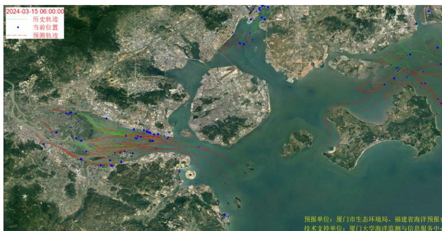
图 1 厦门湾全海域海漂垃圾漂移轨迹预报图