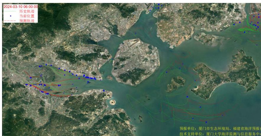
图 1 厦门湾全海域海漂垃圾漂移轨迹预报图