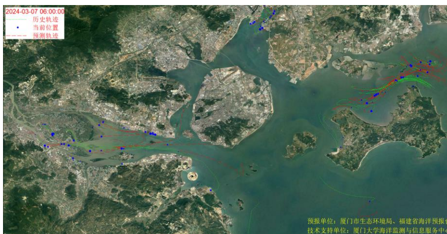
图 1 厦门湾全海域海漂垃圾漂移轨迹预报图