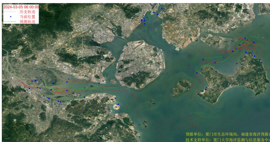
图 1 厦门湾全海域海漂垃圾漂移轨迹预报图