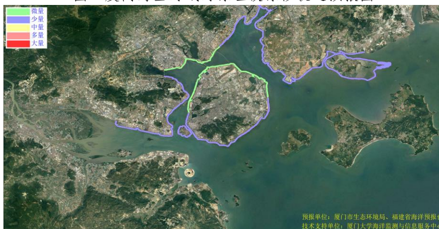
图 2 可能影响厦门市沙滩的垃圾分区图