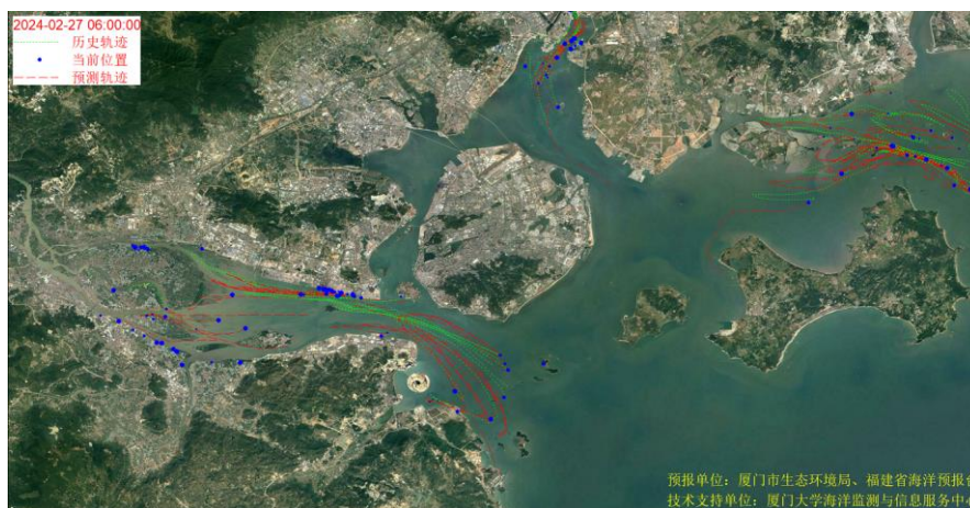
图 1 厦门湾全海域海漂垃圾漂移轨迹预报图