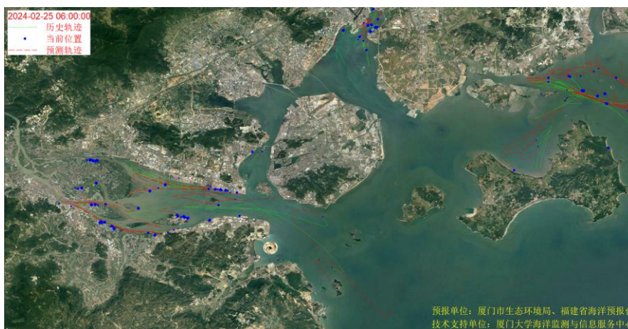
图 1 厦门湾全海域海漂垃圾漂移轨迹预报图