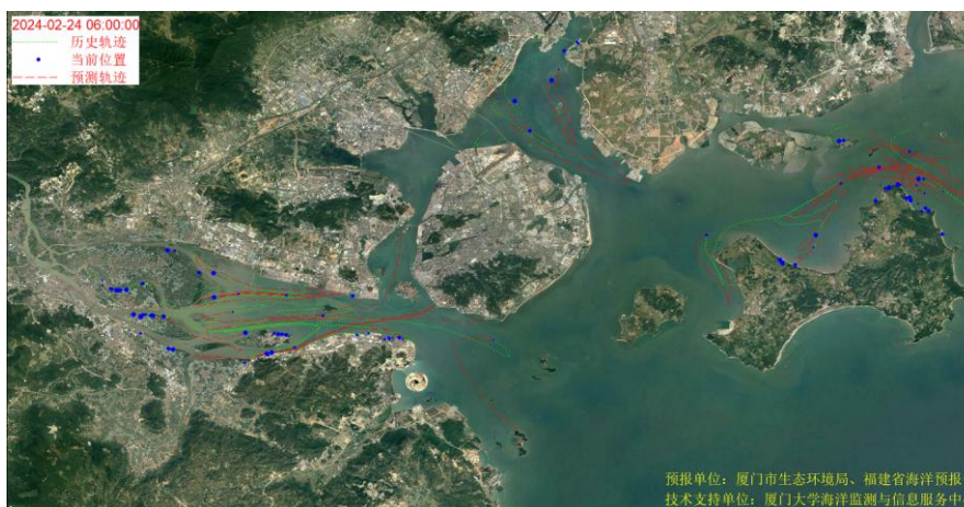
图 1 厦门湾全海域海漂垃圾漂移轨迹预报图