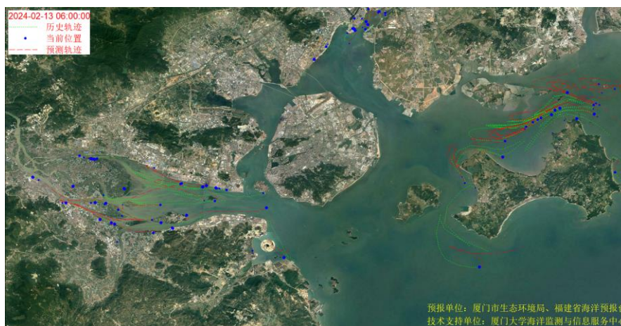
图 1 厦门湾全海域海漂垃圾漂移轨迹预报图