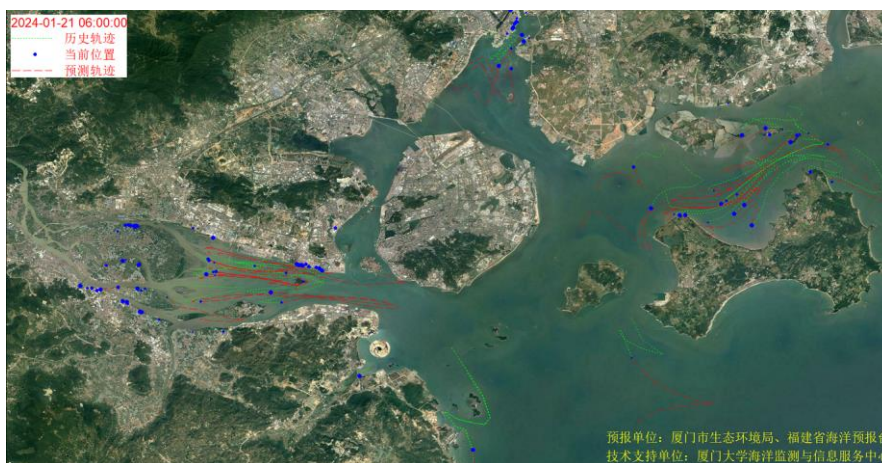
图 1 厦门湾全海域海漂垃圾漂移轨迹预报图