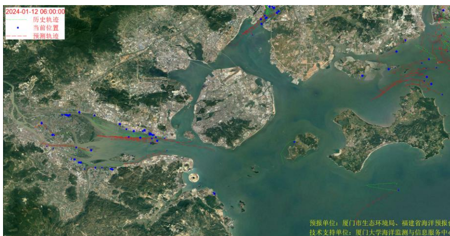
图 1 厦门湾全海域海漂垃圾漂移轨迹预报图