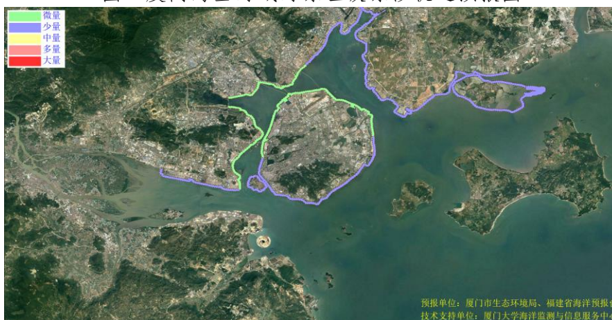
图 2 可能影响厦门市沙滩的垃圾分区图