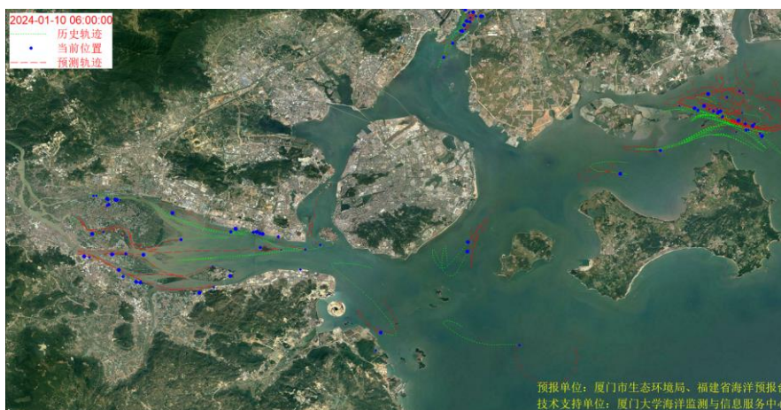
图 1 厦门湾全海域海漂垃圾漂移轨迹预报图