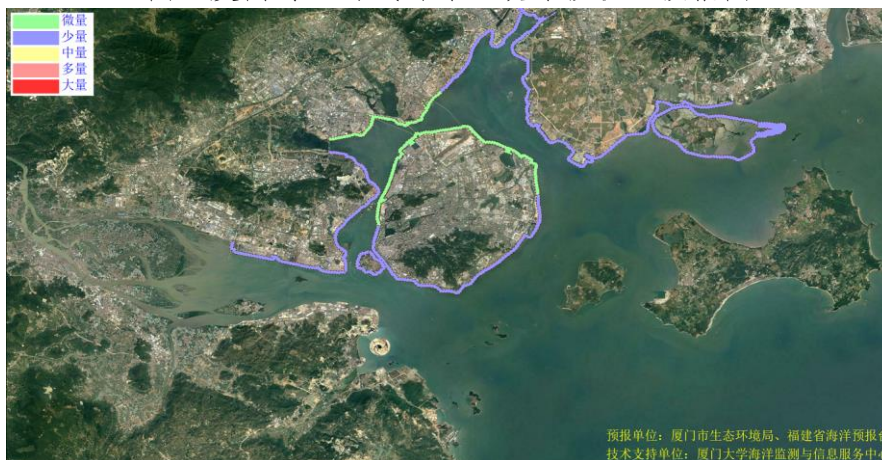
图 2 可能影响厦门市沙滩的垃圾分区图