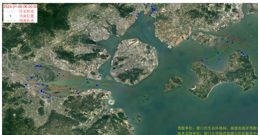
图 1 厦门湾全海域海漂垃圾漂移轨迹预报图